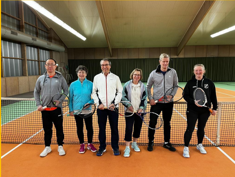
Unser Breitensport-Team beim Freundschaftsspiel in GW Neuss:

stimmenden Kaltgetränk auf dem Programm. Die Berichte der schwärmenden Spielerinnen lassen vermuten, dass es nicht das letzte Mannschaftswochenende dieser Art gewesen sein dürfte.