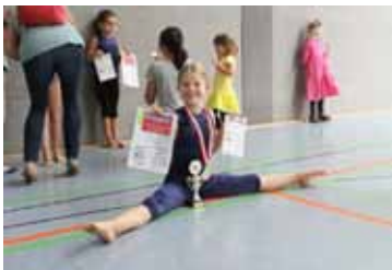
Spagat der Freude