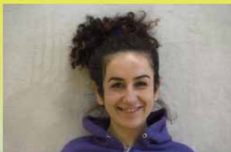
Berivan-Sevda Savgat Tanzen Kid's