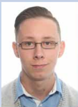
Dominik Kiefeld Sport für Jungen