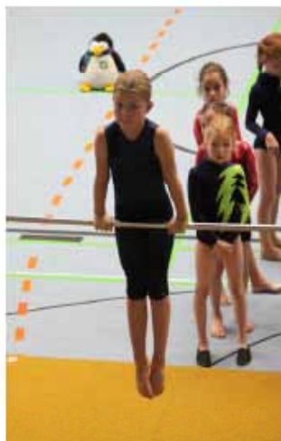
Körperspannung ist das A und O beim Turnen