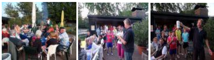
„Volle Hütte“ beim Grillen

Unser Sommerfest zum 40 zigsten Vereinsjubiläum war durch den Spendenwillen aller Mitglieder, dem schönen Wetter und eurer zahlreichen Teilnahme trotz Konkurrenzveranstaltungen ein voller Erfolg.