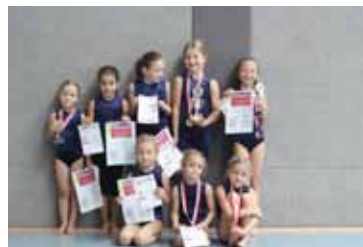
So sehen Sieger aus