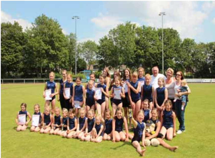
So sehen glückliche Turnerinnen und zufriedene Trainer aus!!