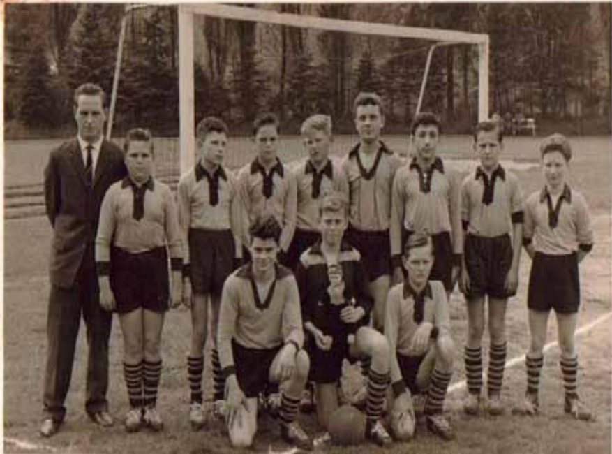
Die D-Jugend des SV-Rosellen aus dem Jahr 1956

Ein Klick lohnt sich für alle Fans der Fußball-Mannschaften des SV Rosellen