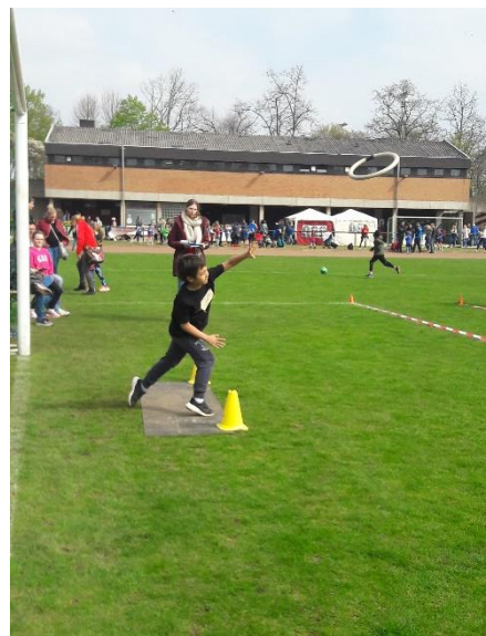
Shin beim Drehwurf