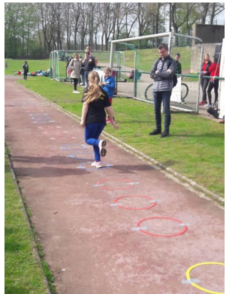
Milla bei den Wechselsprüngen